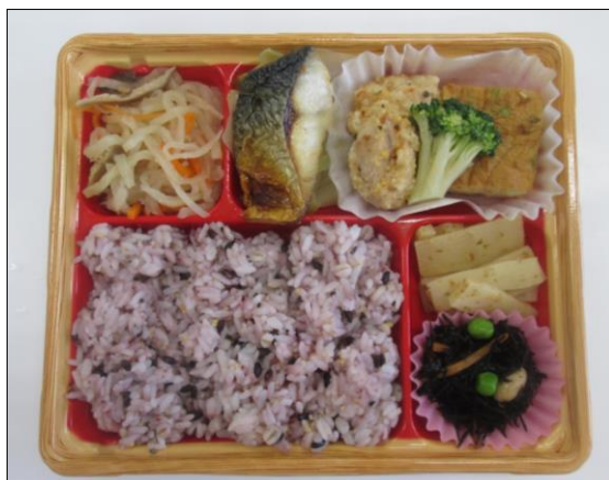
十五穀米とチキンカツレツ

本研究で明らかとなった栄養バランスを取り入れた本学医学部附属病院監修の「1:1:1バランス弁当」を株式会社 グローカル・アイ社より販売することとなりました。販売に先駆けて試食会を開催しますので、この機会にご取材にお越しいただきますようお願いいたします。（試食会の詳細は最終頁ご参照）