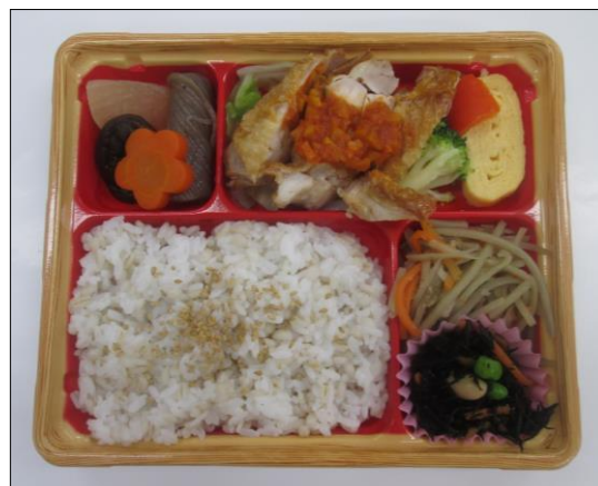
もち麦ご飯とチキンステーキ